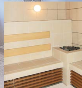
◆ サウナ (スチーム室)